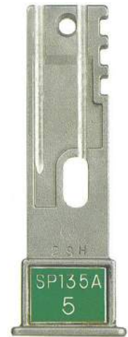
Кодированный ключ к блокирующему устройству

Установка и подгонка на работающих объектах может быть выполнена без остановки технологического процесса и, при этом, не нарушаются гарантии поставщика арматуры. Блокирующие устройства применяются в заводских условиях и на морских объектах с целью обеспечения надёжности процессов и безопасности персонала в следующих типовых случаях: