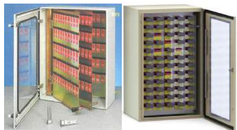
Операторные сейфы для ключей с визуальным контролем готовности изготавливаются в различных вариантах исполнения

Блокирующие устройства просты в эксплуатации и тем самым уменьшают вероятность нарушения установленного технологического режима или повреждения оборудования. Когда требуется выполнить процедуру на блокирующей системе, с разрешения соответствующего руководства из «Операторного сейфа для ключей с визуальным контролем готовности» извлекается так называемый иницирующий (допускающий) ключ.