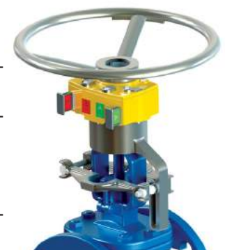
МОДЕЛЬ GL для арматуры, управляемой штурвалом