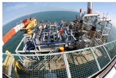
Блоки предклапанов с переключающим устройством