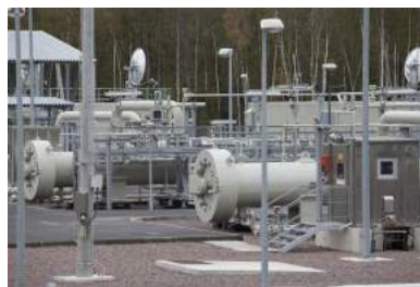
Системы приёма и запуска очистительных снарядов и диагностических устройств