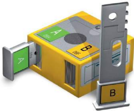
Блокирующее устройство с механизмом заперения ключей

Блокирующее устройство - это полностью механический блок, управляемый специальным ключом и предназначенный для обеспечения безопасности технологических процессов и защиты окружающей среды в нефтяной, нефтехимической, газовой промышленности и связанных с ними областях. Оно может быть смонтировано непосредственно на вале / штоке запорного органа и позволяет запереть (фиксировать) арматуру в позиции «открыто» или «закрыто». Устройства могут быть выбраны и подогнаны для существующего оборудования, а также установлены на вновь монтируемых объектах без каких-либо модификаций и изменений проекта.